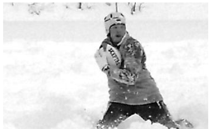
雪中ラグビーの様子