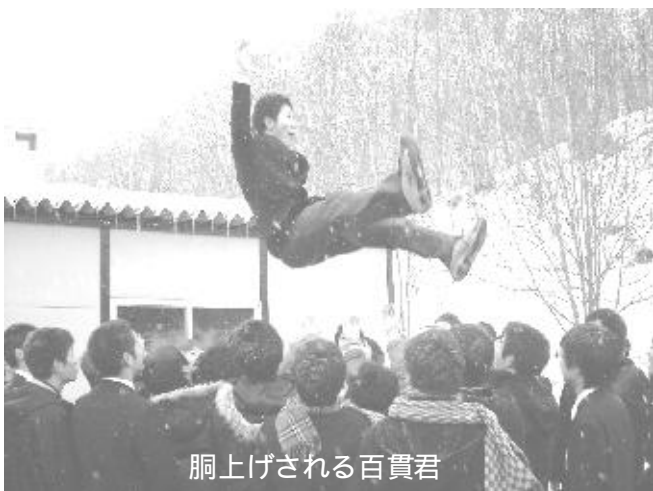
胴上げされる百貫君